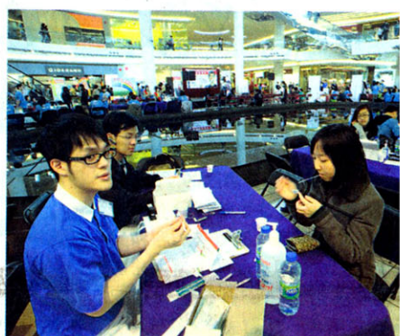
義工及眾多幹細胞登記人士，為華裔病者出一分力。