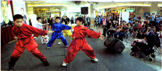
劍風體育會的小朋友，在台上表演武術為活動加油。