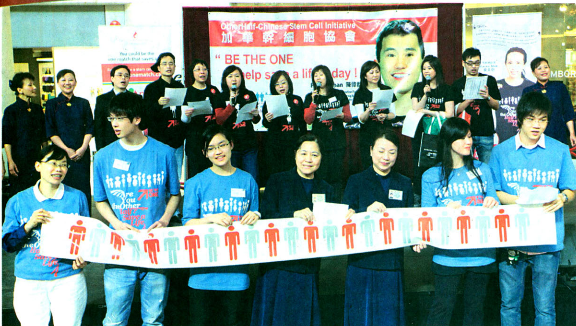
在結束前，所有嘉賓、義工團及幹細胞登記行動籌委會成員，台上高唱《明天會更好》。

參與「326全國華人幹細胞登記行動」的義工及眾多登記者，為有需要幹細胞移植的華人病者，帶來最實在的希望，盡顯人間有情，及華人守望相助的可貴精神。