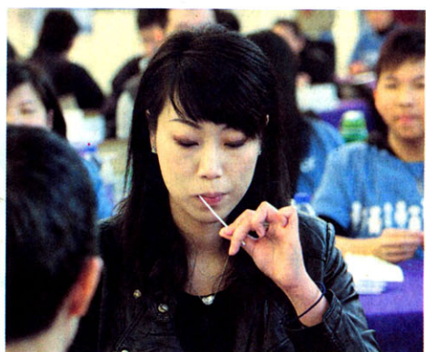
現場不少年輕人踴躍參加登記，愛心盡顯。