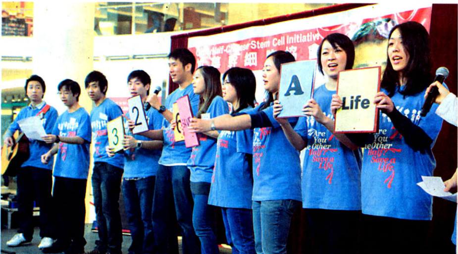
卑詩大學及西門菲沙大學的學生，除了擔任義工之外，更高歌為活動創作的《326救一命》。