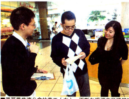
溫哥華慈濟分會的義工（左），不斷向現場市民講解活動，及鼓勵他們登記。