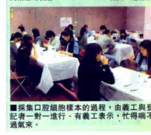
採集口腔細胞樣本的過程，由義工與登記者一對一進行。有義工表示，忙得喘不過氣來。

此外，卑詩省議員李燦明也有到場支持。他認為幹細胞登記行動值得鼓勵，只要每個人都多作推廣，叫親戚朋友參與，就有更多機會讓華人血癌患者找到細胞配對，得到治療的機會。