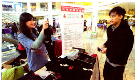
大會設立T恤義賣攤位，吸引不少市民上前購買，以作支持。