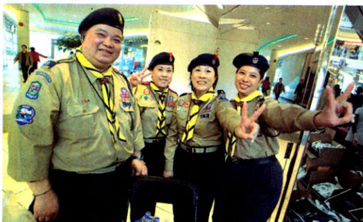
參與義工工作的烈治文第33團童軍領袖，高舉勝利手勢慶祝活動舉辦空前成功。