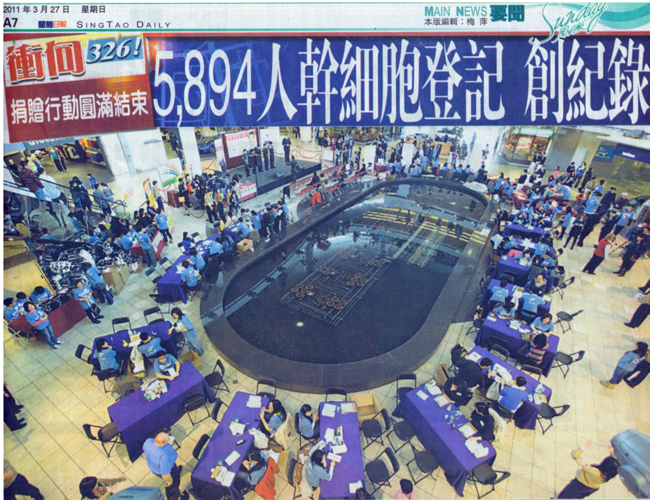
烈治文的時代坊，擠滿到來登記的熱心市民，場面壯觀。

由加華幹細胞協會舉辦的「326全國華人幹細胞登記行動」，周六在卑詩省溫哥華、亞省卡加利和安省多倫多三城市同步展開，連同先前的外展收集活動，總共收集及登記5,894個捐贈者，比去年4,025人，多出1,869人，數字再創新高，除了令人振奮之外，也代表華人血癌病人今後多了尋得合適幹細胞續命的機會。相關新聞見A8,A10