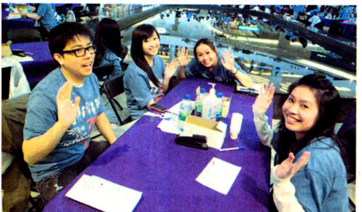
現場為市民收集樣本的義工，慶祝活動舉辦成功。